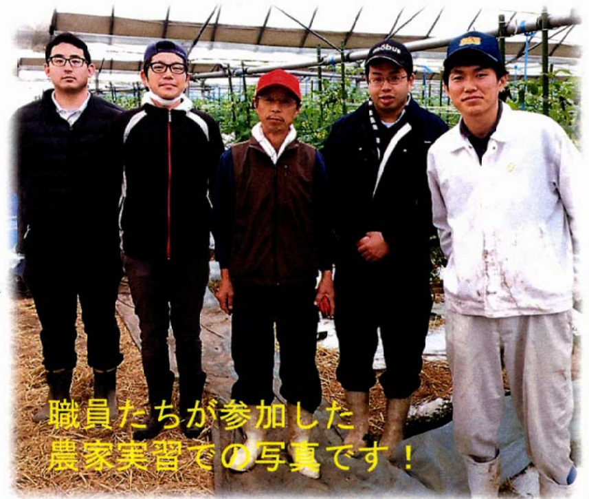
職員たちが参加した 農家実習での写真です！