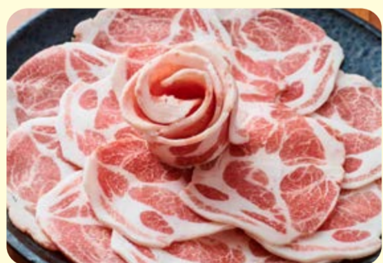
熊本県産ブランド豚肉 しゃぶしゃぶセット 50名様 (くまもとSPF豚&りんどうポーク)