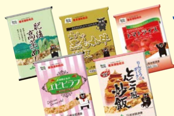
冷凍米飯セット (10パック入) 50名様