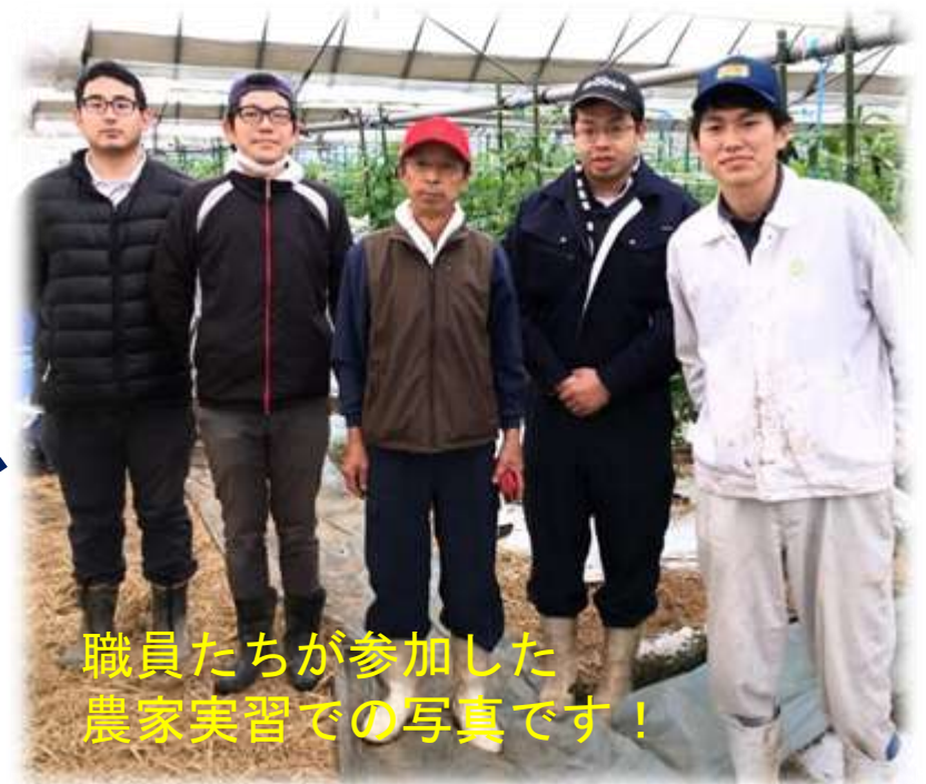
職員たちが参加した 農家実習での写真です！